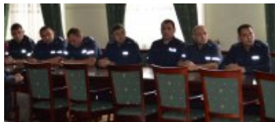
dzielnicowi KPP Poddębice