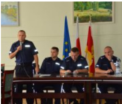
wystąpienie Kierownika Dzielnicowych