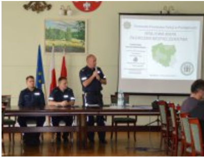
przywitanie zaproszonych gości przez Komendanta Powiatowego Policji