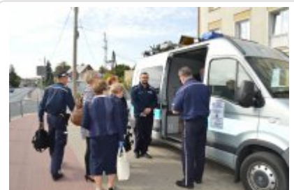
mobilny punkt informacyjny