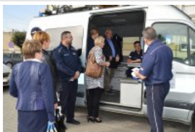
mobilny punkt informacyjny