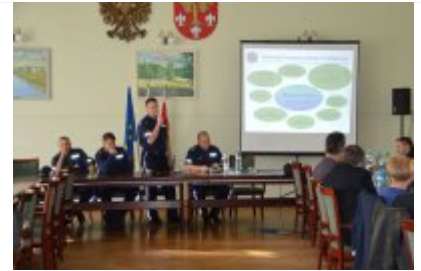
wystąpienie Naczelnika Wydziału Prewencji