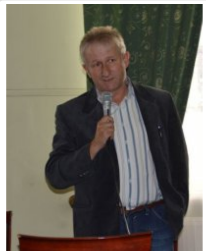
wystąpienie Prezesa LKS Ner